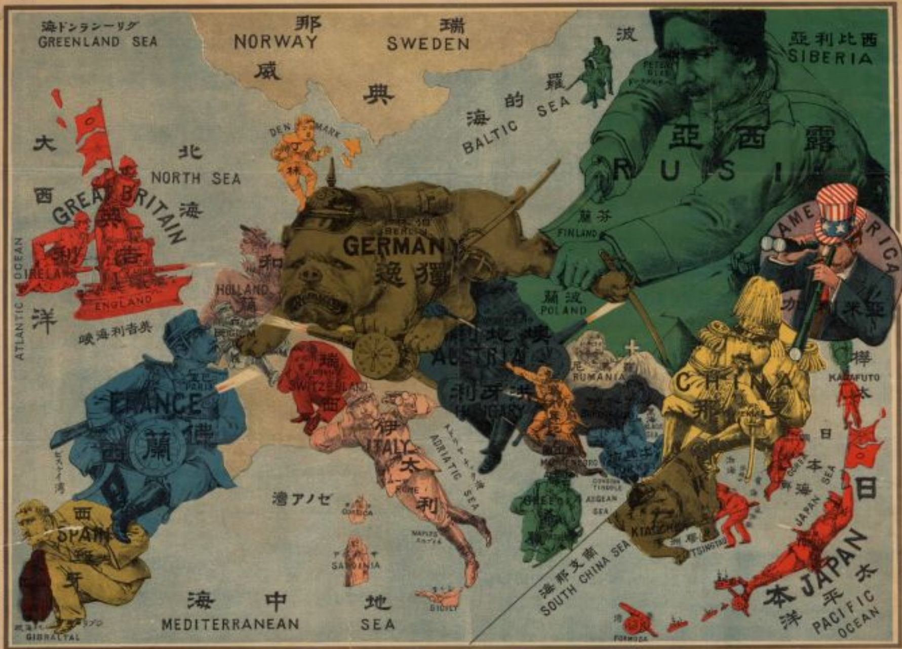
AHUMOROS WAP MAP OF THE WORLD.